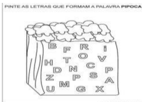
IMAGEM DA ATIVIDADE.